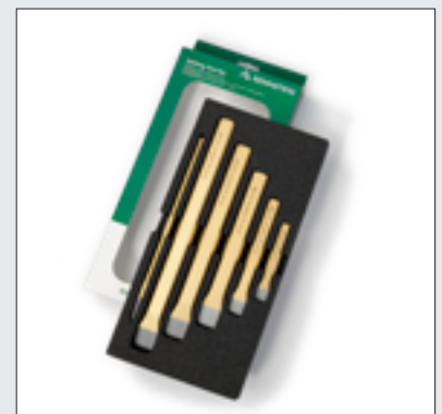
Praktische Schaumstoffeinlage sorgt für Ordnung am Arbeitsplatz

Quality under the surface: full body hardened Tempered safety striking head