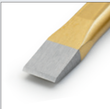
Hochwertige Werkzeuge - Poliertes Arbeitsende, geschliffene Schneide

Industrial quality tools Polished blade, ground edge