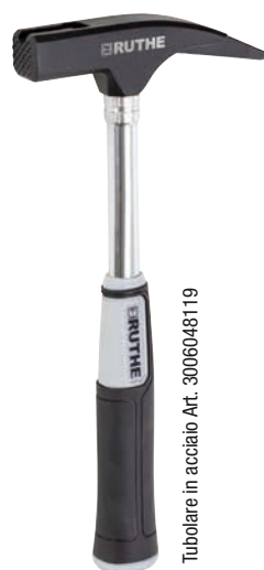
Tubolare in acciaio Art. 3006048119