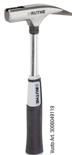
Vuoto Art. 3006049119