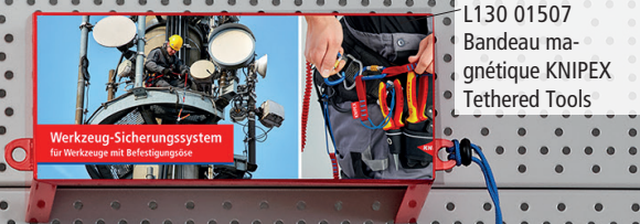
L130 01507 Bandeau magnétique KNIPEX Tethered Tools