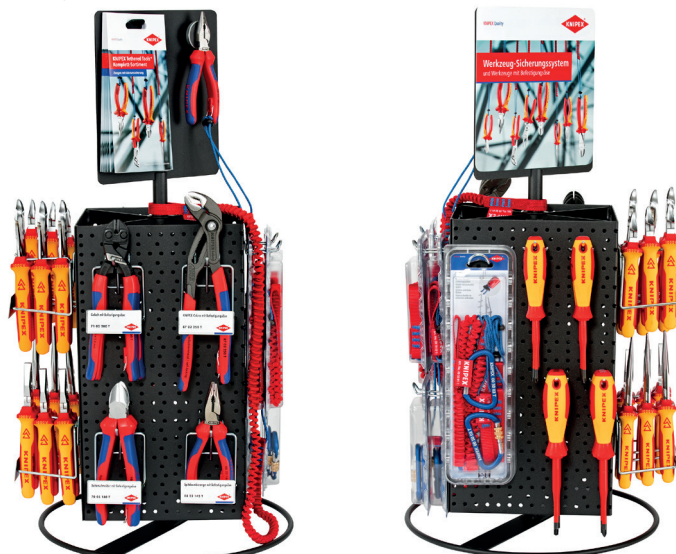
Vue face 3 et 4

Nouveau concept de présentation attrayant pour la gamme KNIPEX Tethered Tools. Exemple d'implantation : Votre partenaire de contact au sein de KNIPEX se fera un plaisir d'établir avec vous une garniture personnalisée adaptée.