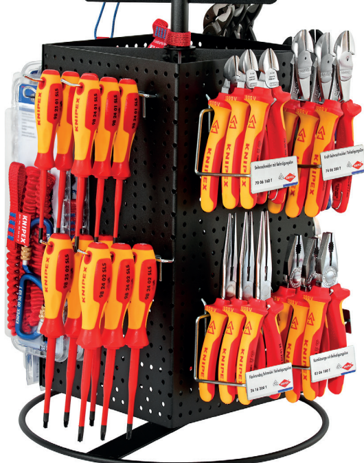
Vue face 2