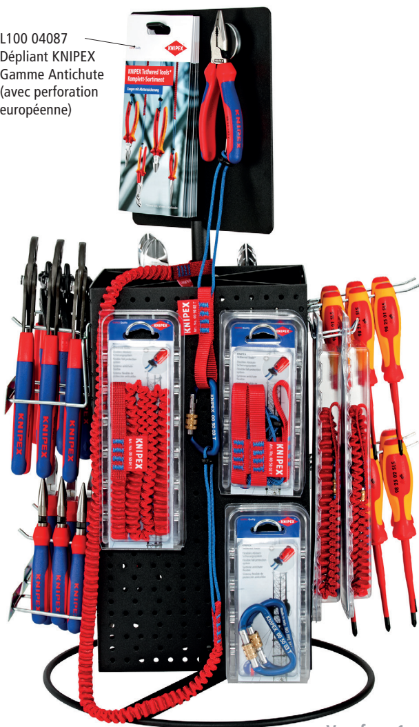
Vue face 1

L100 04087 Dépliant KNIPEX Gamme Antichute (avec perforation européenne)