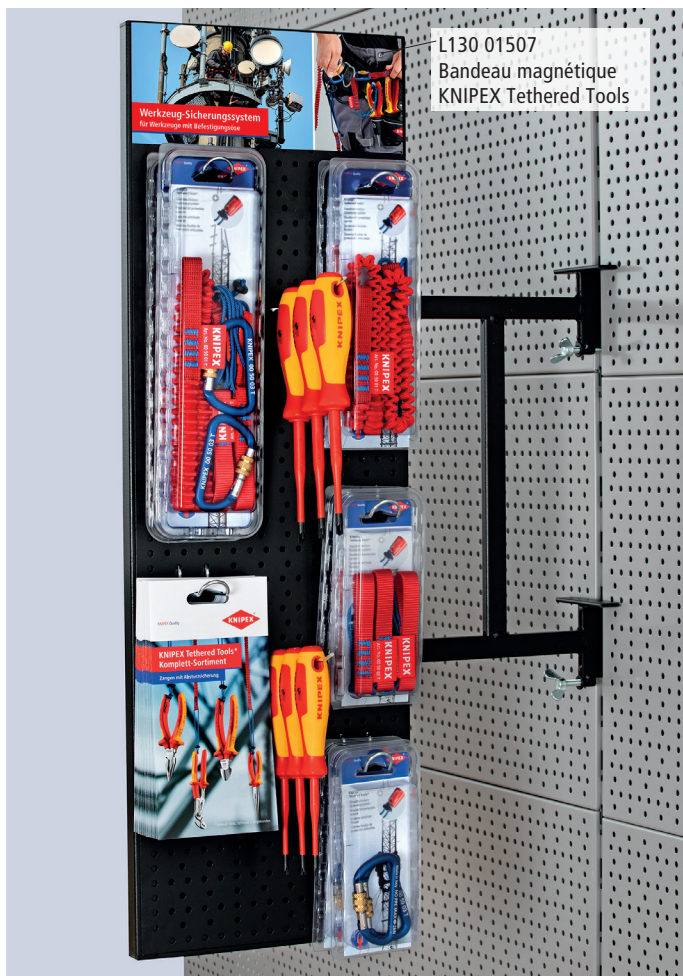
Vue face 2