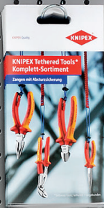
L100 04087 Dépliant KNIPEX Tethered Tools (avec perforation européenne)